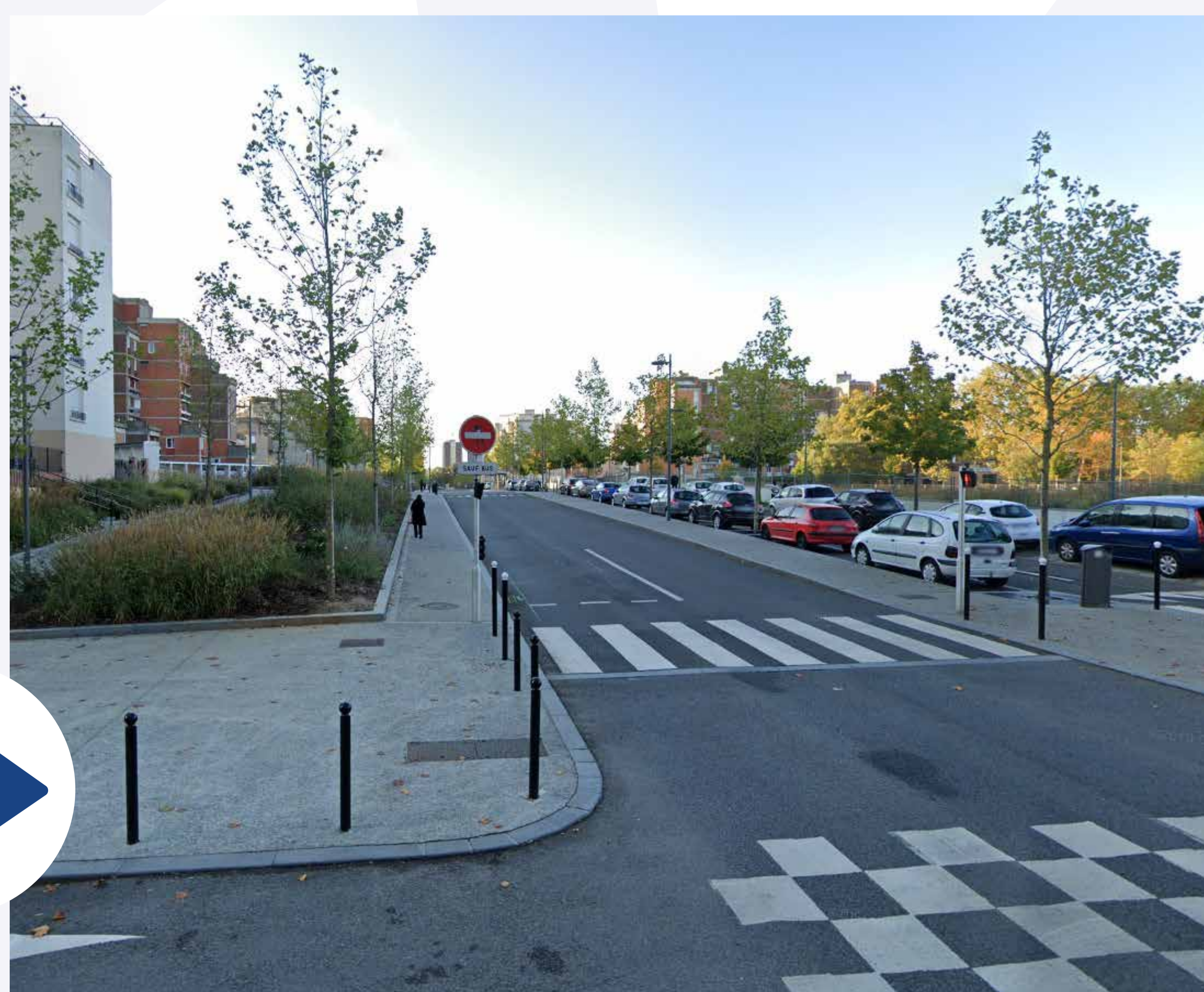
La nouvelle voie créée place Salvador Allende, en 2019.