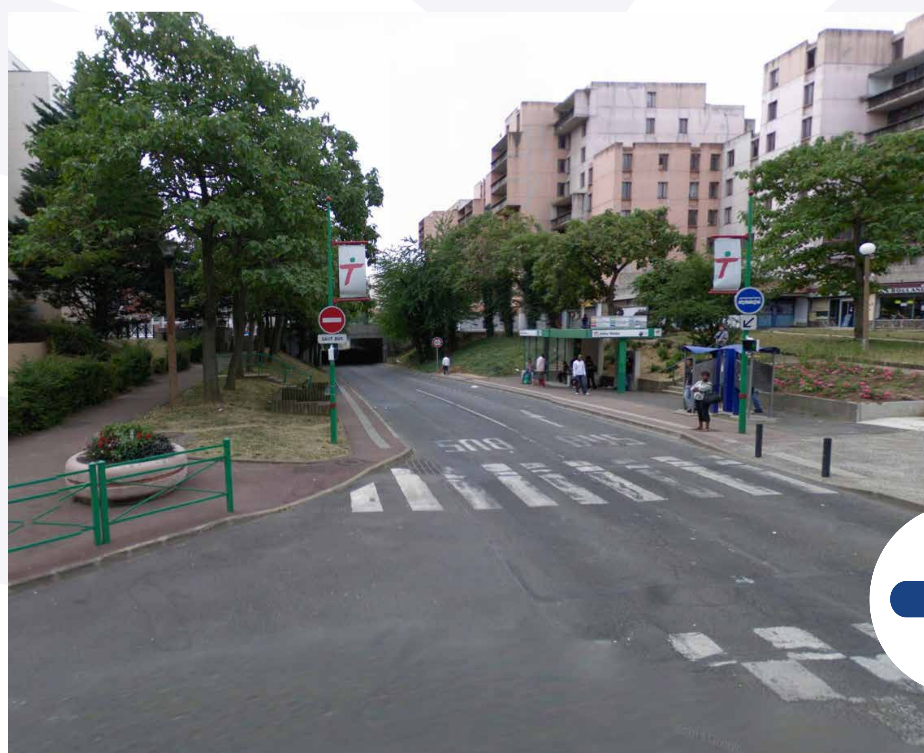
Le passage du bus en site propre sous la dalle, en 2008.