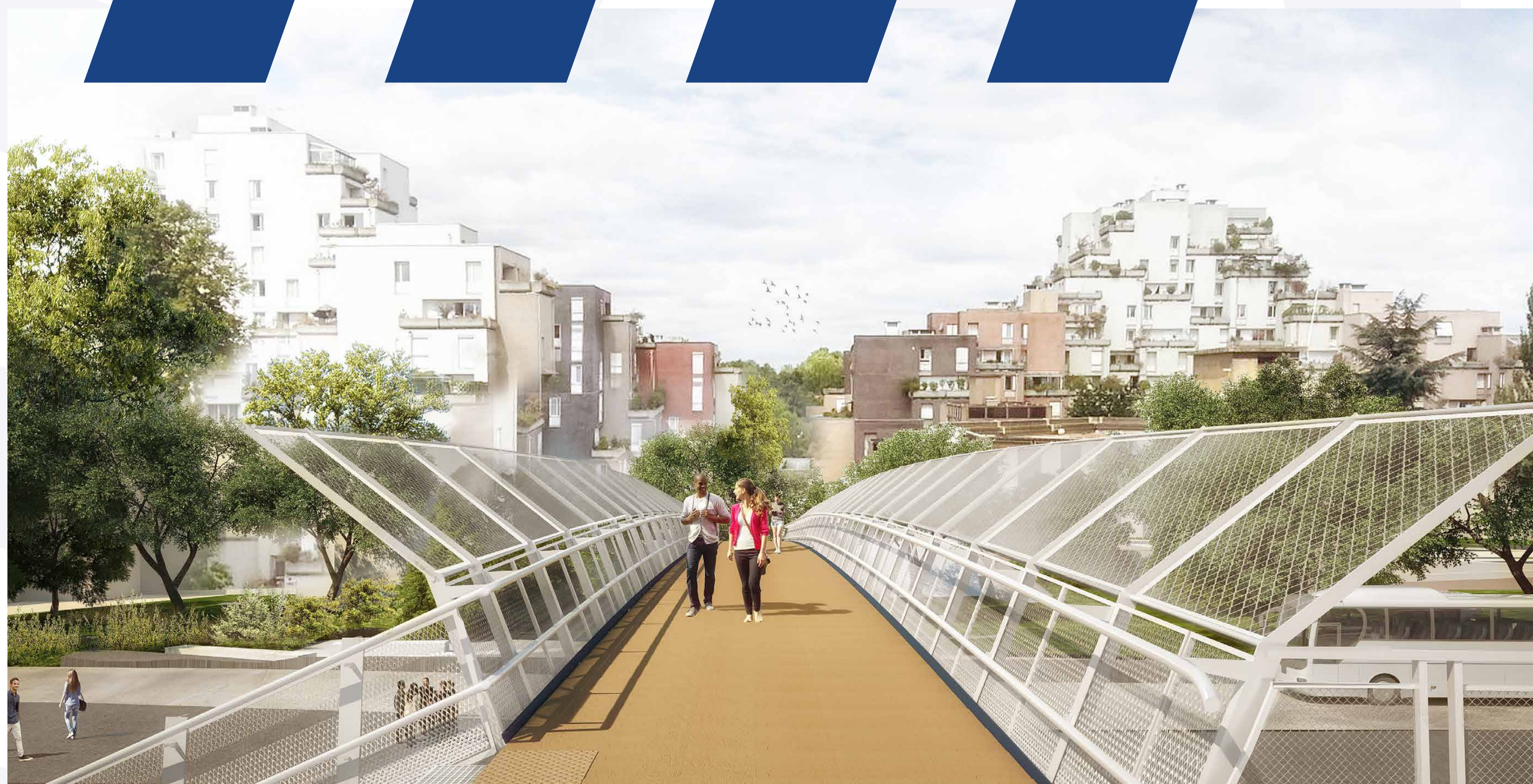
Perspective de la nouvelle passerelle piétonne.

Les travaux ont permis d'ouvrir le quartier des Pyramides sur le centre-ville et le centre commercial.