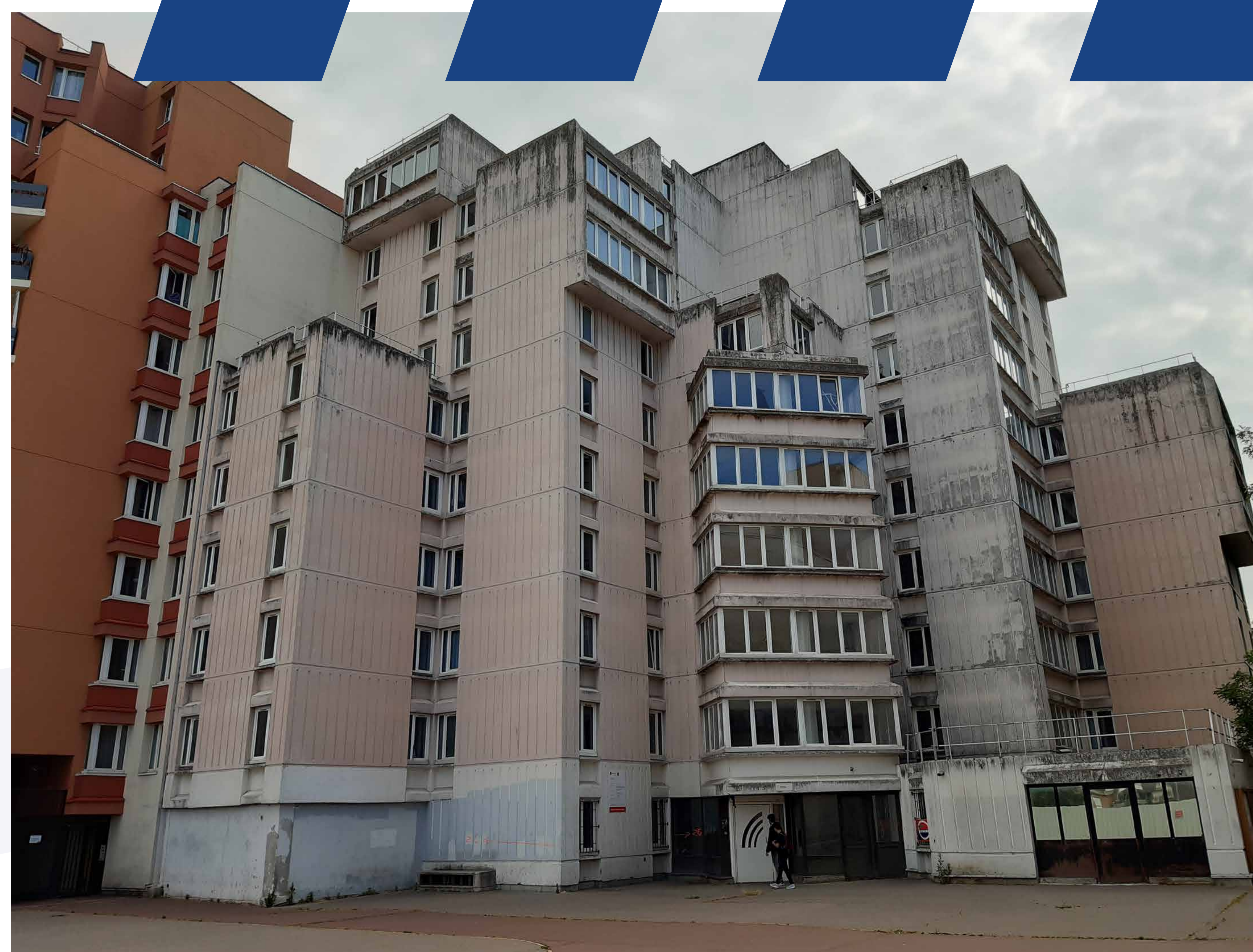
Le foyer de travailleurs migrants d'Adoma.

La démolition du bâtiment ouvrira une percée visuelle et une continuité piétonne entre la nouvelle place des Miroirs, avec à terme la nouvelle station de bus, et la rue du Facteur Cheval.