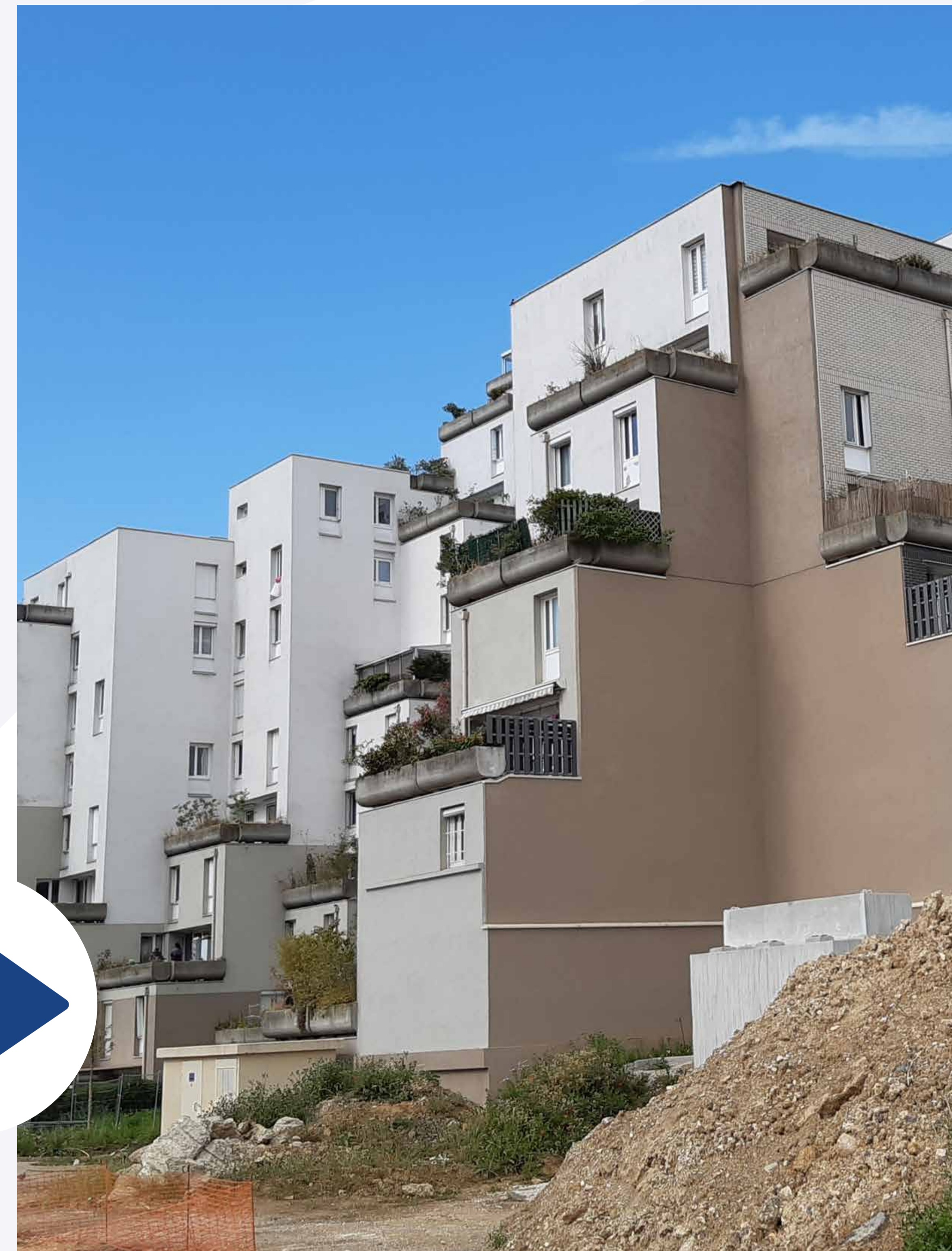
Dragon Miroirs, avant et après rénovation.