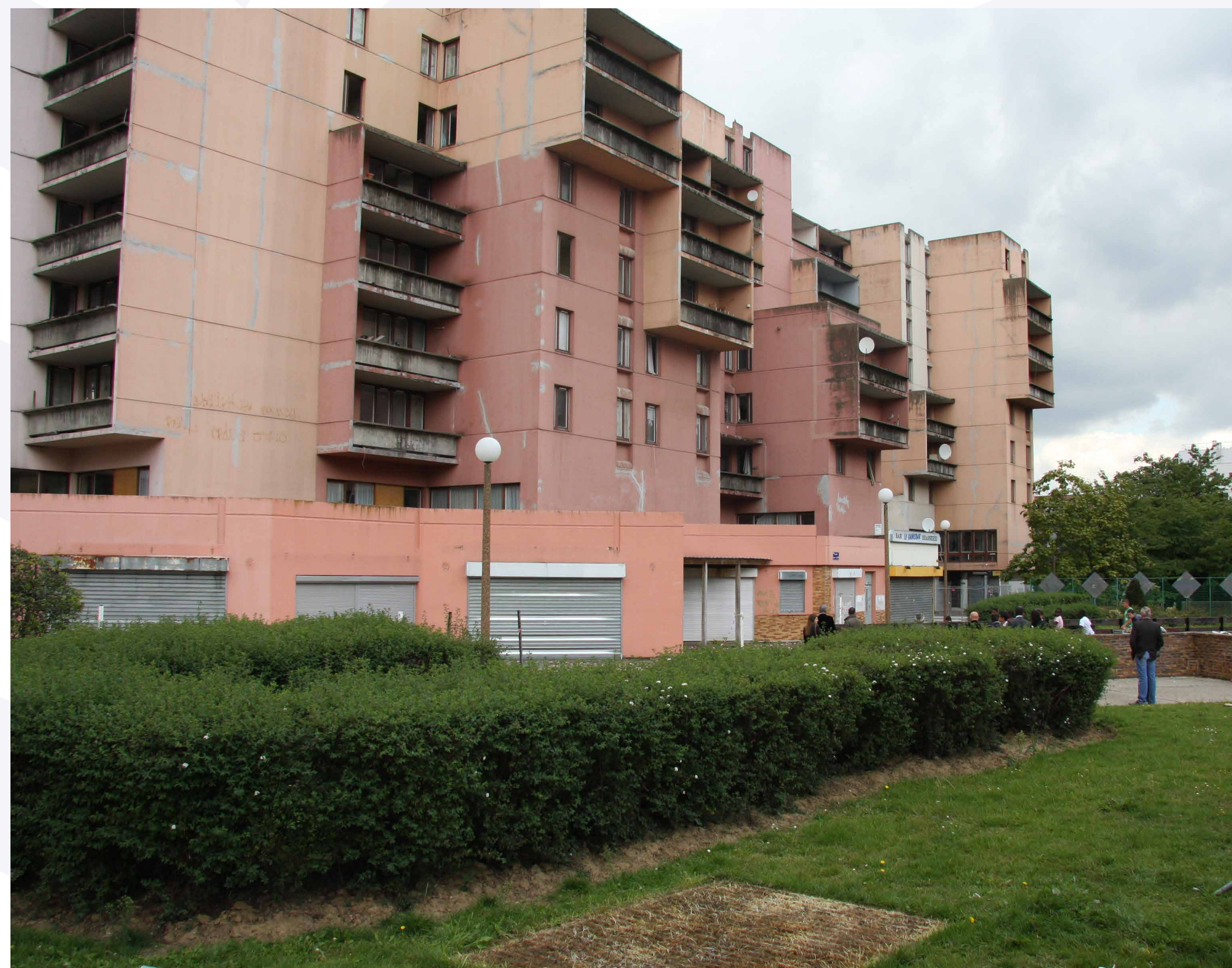
Inexploité depuis de nombreuses années, le site de l'ancienne Caravelle s'apprête à revivre et à retrouver sa position centrale au cœur des Pyramides.