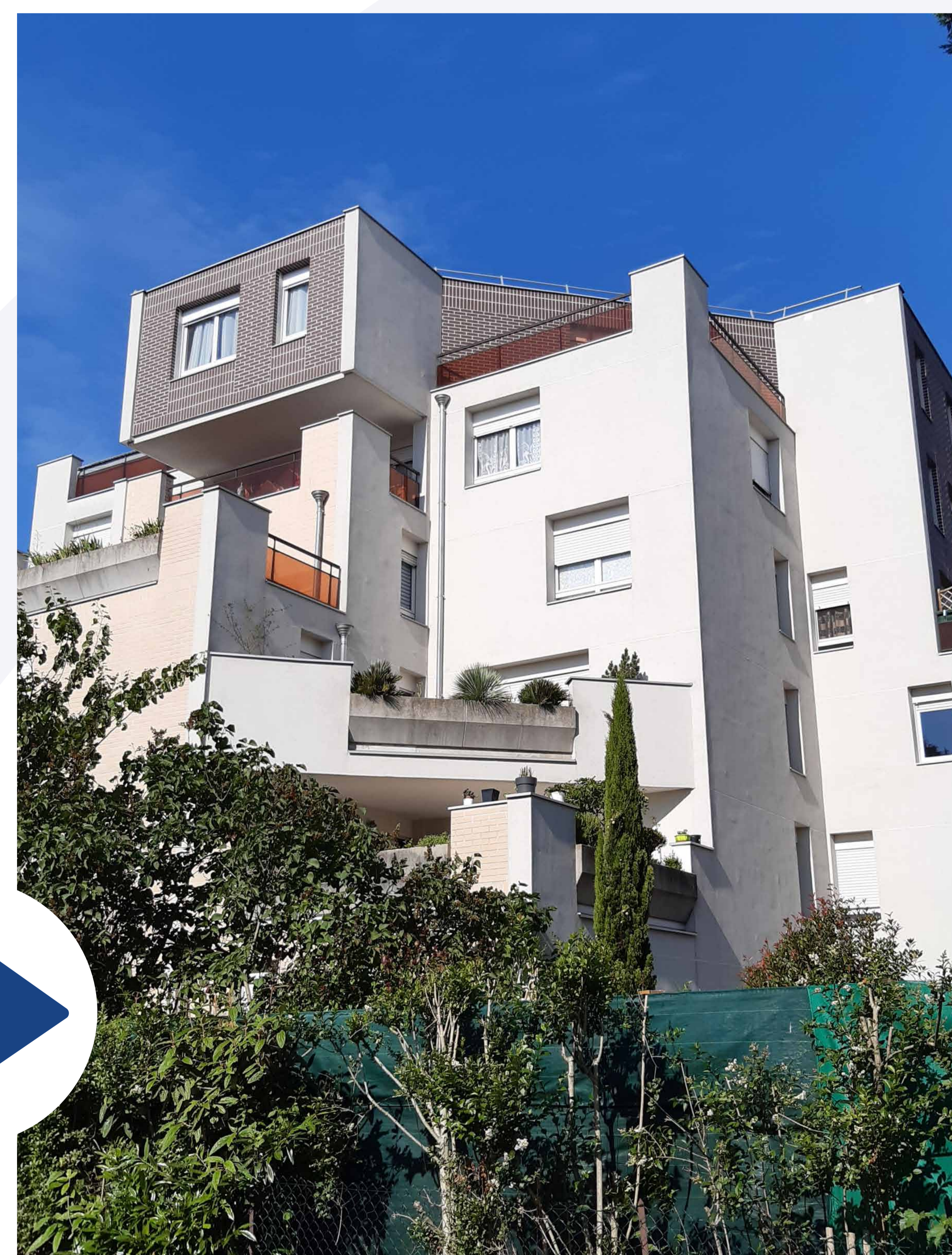
Les Provençales, avant et après rénovation.

En plus des travaux menés avec l'Agence Nationale pour la Rénovation Urbaine (ANRU), plusieurs copropriétés vont engager des travaux de réhabilitation.