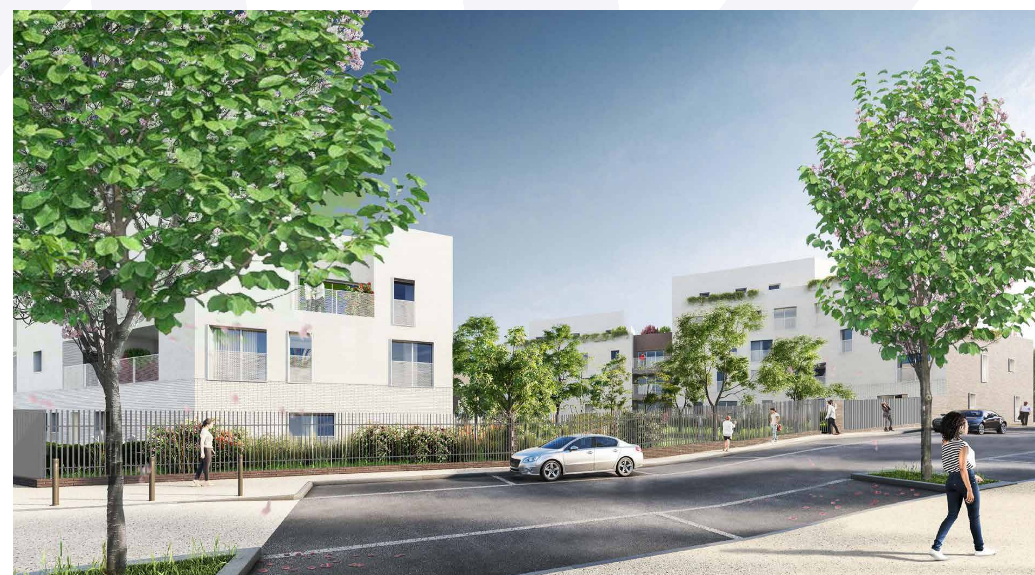
Vue depuis l'angle de la rue de la Poule Rousse et de la place Salvador Allende.

À terme, la construction d'un centre socio-culturel municipal, véritable lieu de rencontre à l'échelle du quartier, est prévue pour ce site. De quoi rendre au secteur de la Caravelle sa vocation de cœur des Pyramides.