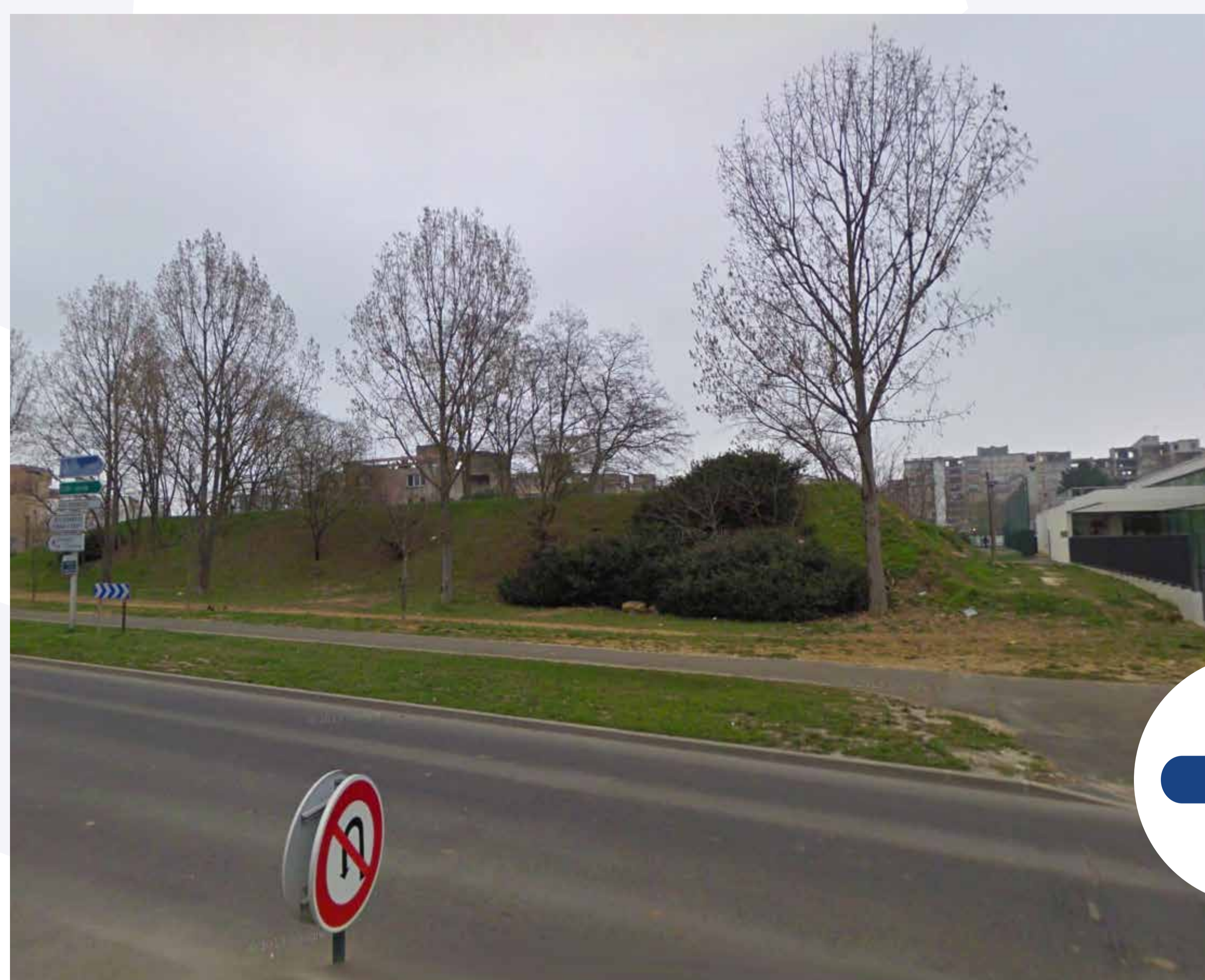
Le futur mail Jules Ferry, 2011.