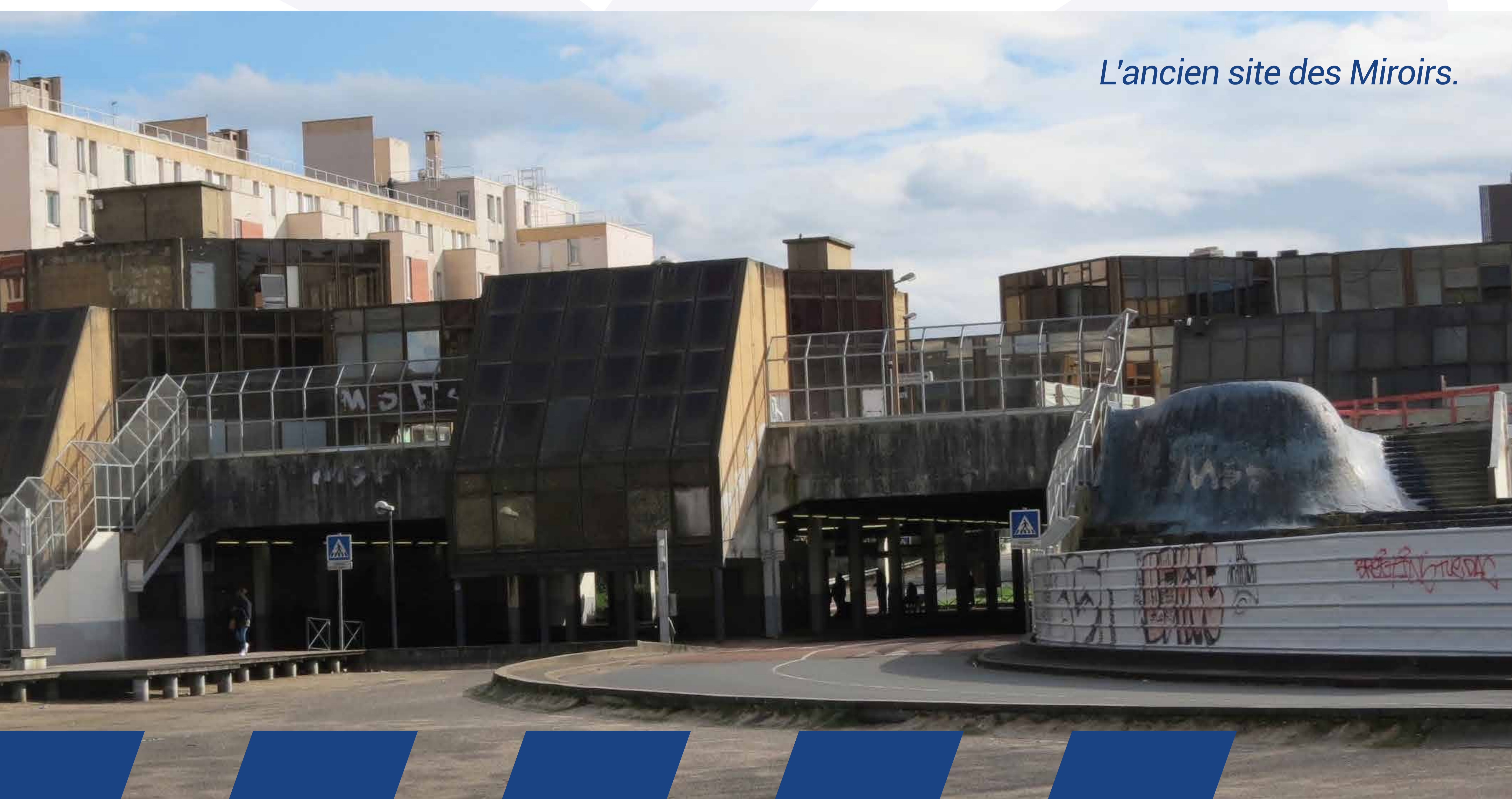
L'ancien site des Miroirs.