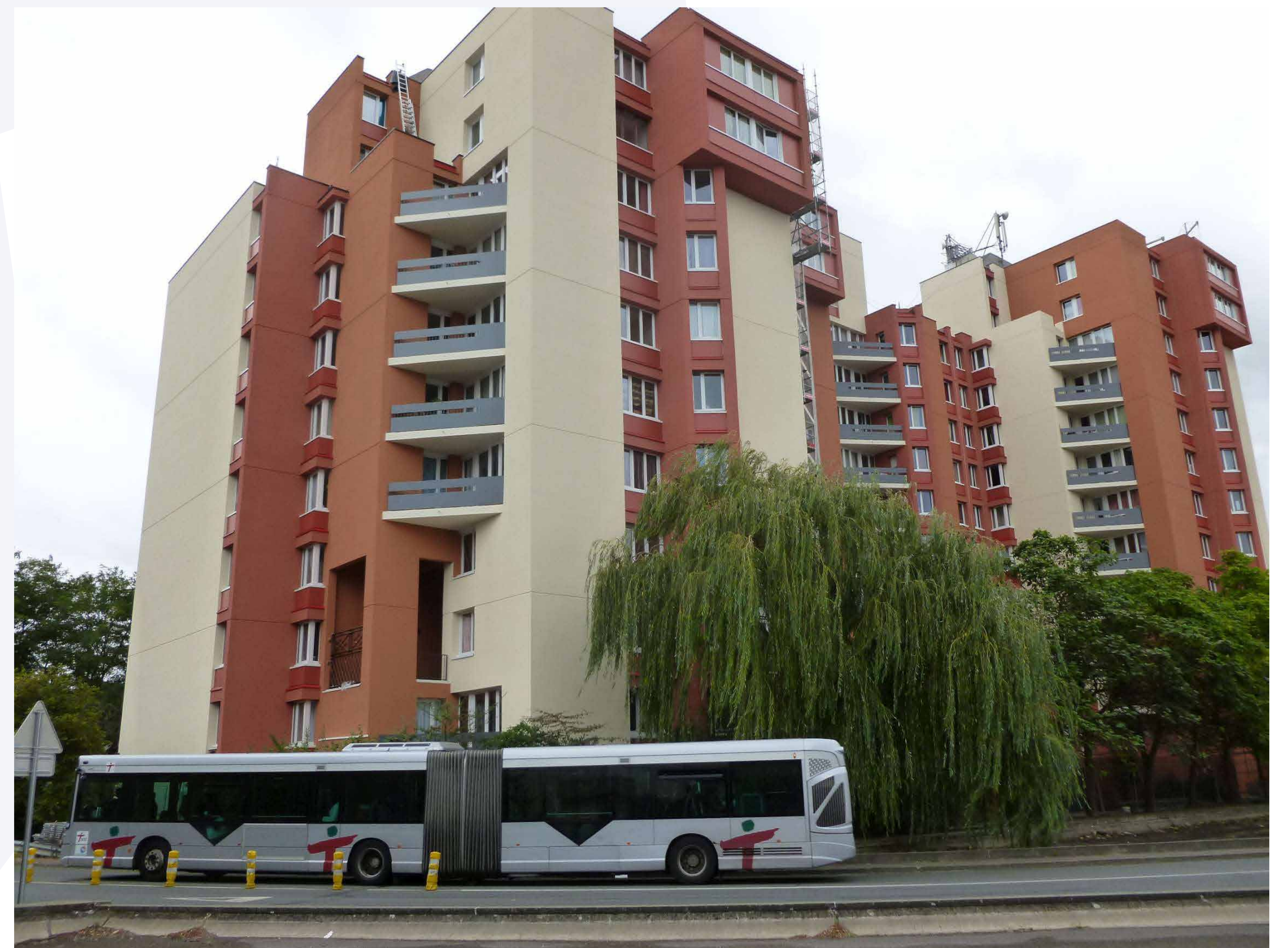
La résidence des Tourelles avant/après la réhabilitation par le bailleur Antin Résidences avec le soutien de l'ANRU.