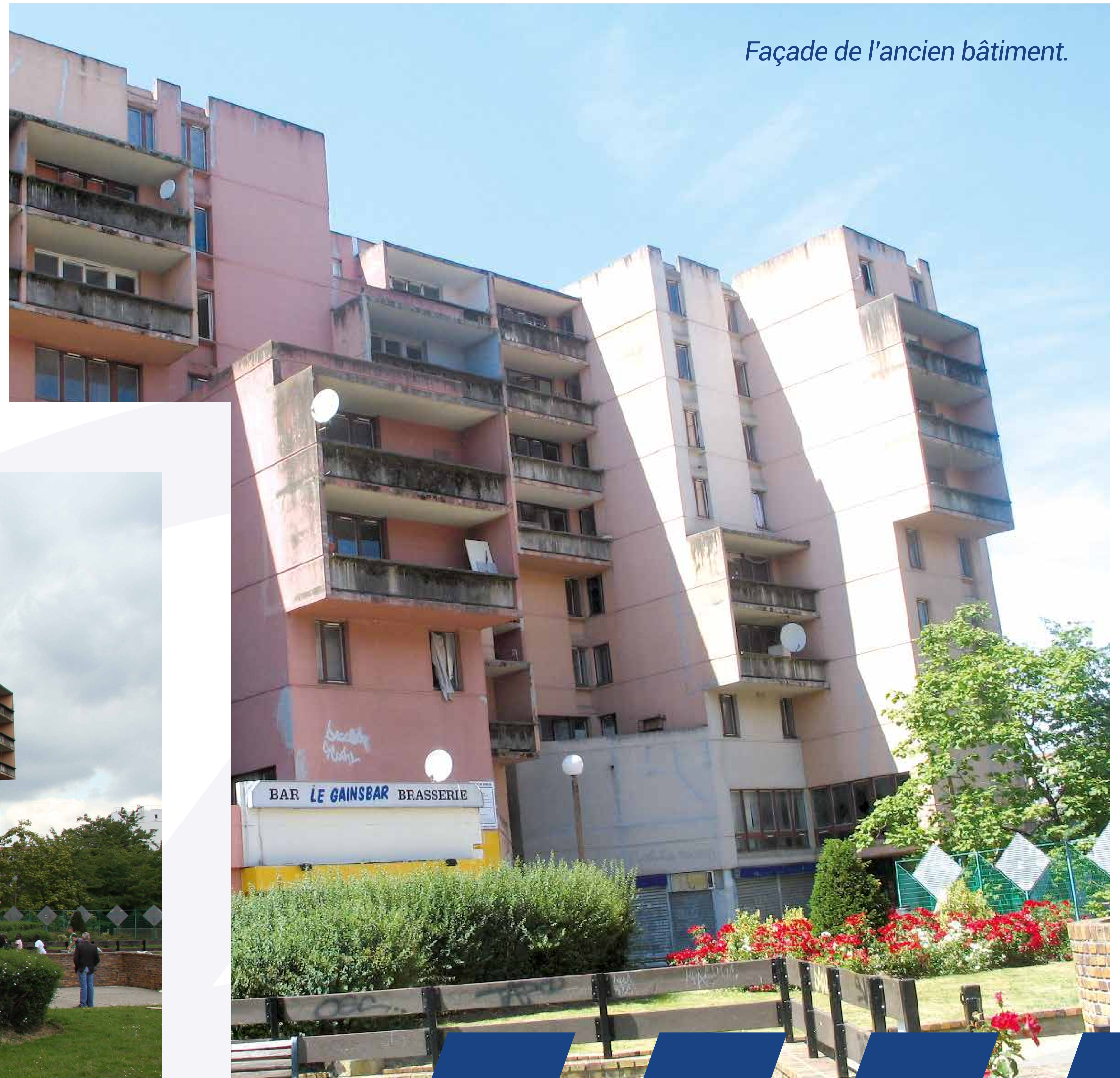
Façade de l'ancien bâtiment.

Construit en 1977, l'ancien immeuble de la Caravelle comptait 122 logements. Devenu vétuste, il a été démolé en 2010. Les travaux de réhabilitation étaient trop importants pour être envisagés, le bâtiment concentrait également des problèmes de sécurité.