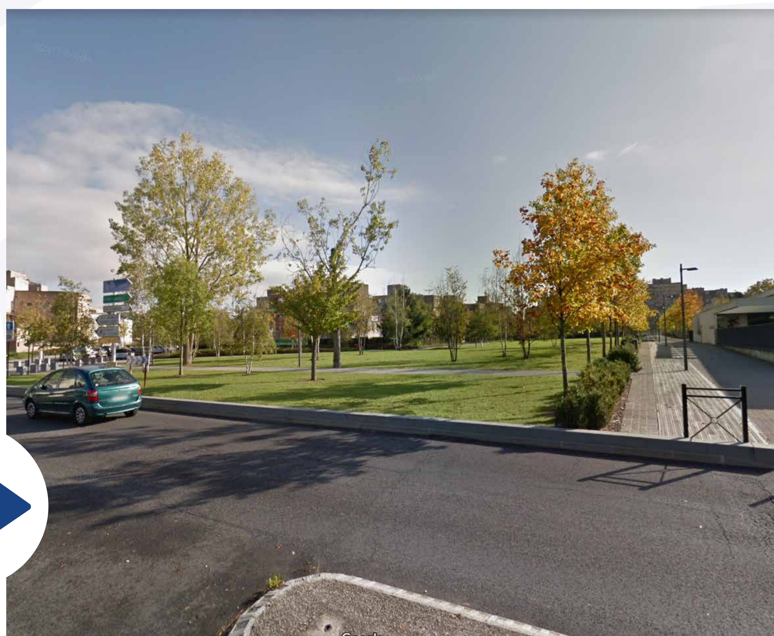
Le mail Jules Ferry après travaux, en 2017.