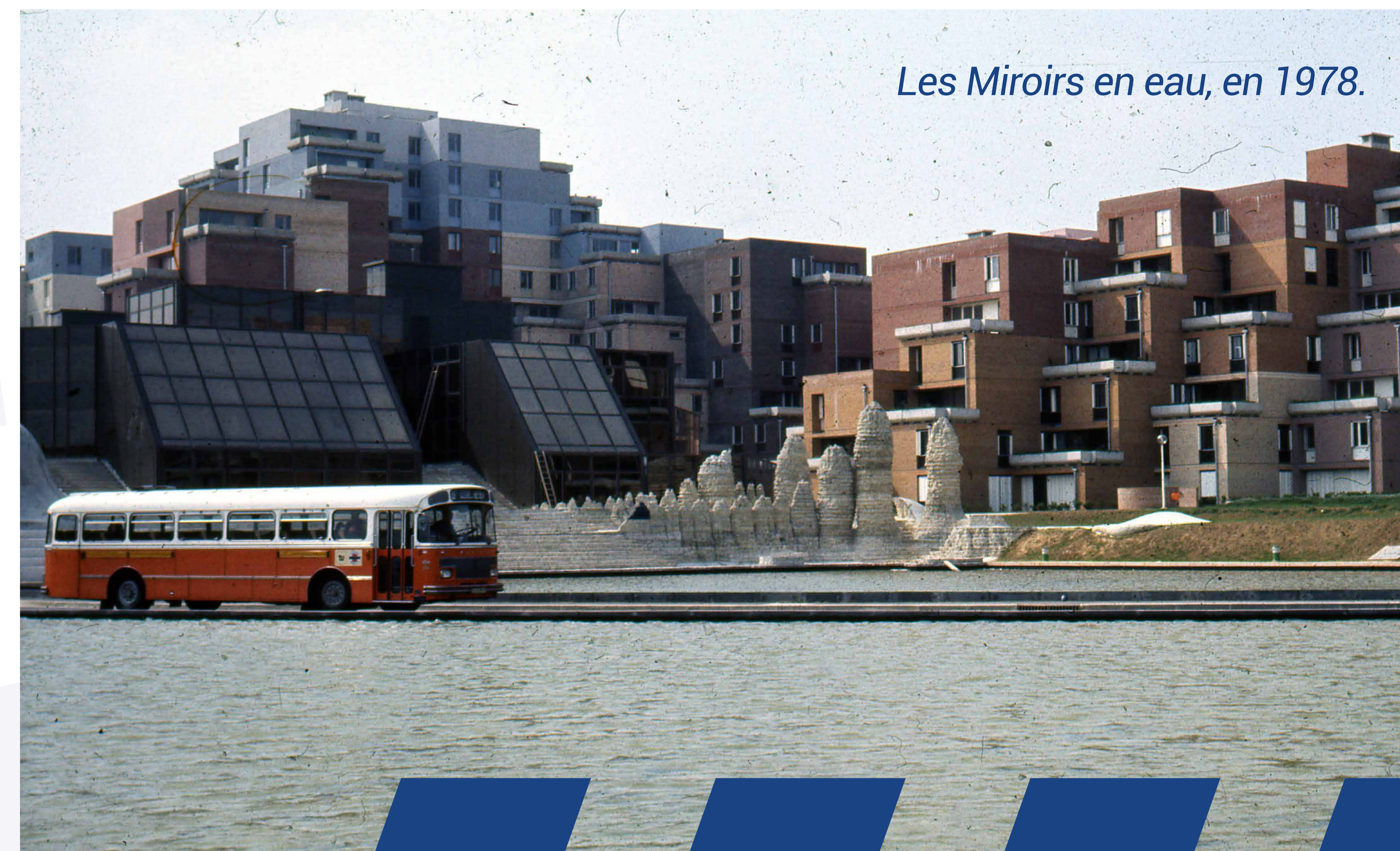
Les Miroirs en eau, en 1978.

Le premier programme de renouvellement urbain fixait le désenclavement du quartier comme un enjeu majeur pour ce site. C'est ainsi que le projet de réaménagement de la dalle des Miroirs prévoit la démolition de l'ensemble immobilier, ainsi qu'une refonte complète des espaces publics pour créer du lien.