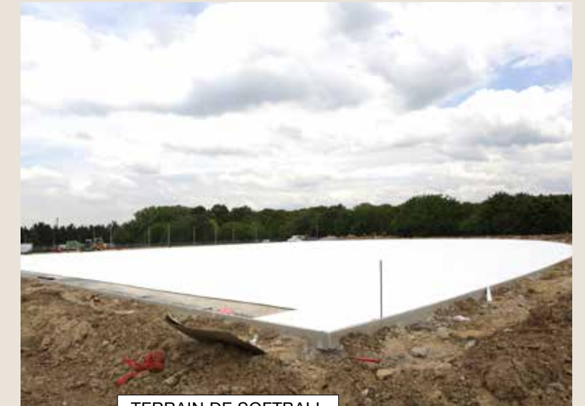
TERRAIN DE SOFTBALL

Jusqu'à la fin du mois de juin, la société Total réalise des travaux de sécurisation de son pipeline sur la parking public rue François Mauriac, face à la Pagode d'Évry-Courcouronnes. Dans ce cadre des places de stationnement sont neutralisées au fur et à mesure de l'avancement du chantier. Parallèlement et toujours sur ce même réseau, Total réalise depuis le 24 mai et jusqu'au 24 juillet des travaux de sécurisation du pipeline au niveau de la bretelle d'accès entre l'avenue du Général Patton et le chemin de halage, côté rue Pissonnier. Dans ce cadre une déviation sera mise en place pour les automobilistes.