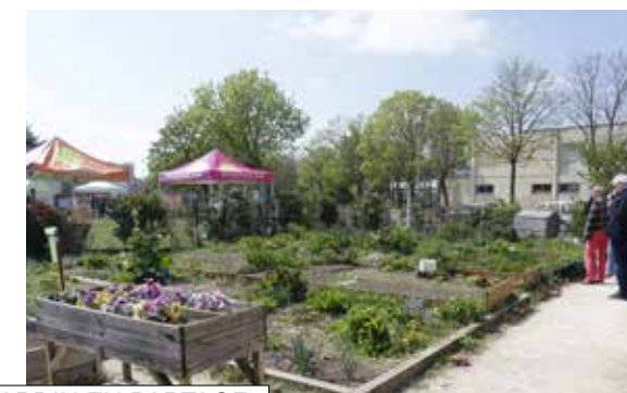
JARDIN EN PARTAGE

L'agglomération Grand Paris Sud vous propose des balades à vélo familiales et inédites pour découvrir des lieux remarquables et méconnus d'Évry-Courcouronnes et des villes alentour. Des promenades « clef en main » élaborées et testées par l'association Provélo 91 et disponibles sur l'application mobile Geovelo ou en version PDF sur le site sortir.grandparissud.fr.