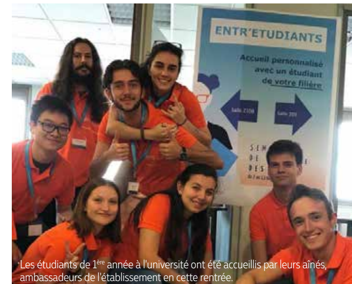
Les étudiants de 1 ère année à l'université ont été accueillis par leurs aînés, ambassadeurs de l'établissement en cette rentrée.

Aujourd'hui, Télécom SudParis forme sur la ville d'Évry-Courcouronnes 1 000 étudiants par an sur un campus de 8 hectares partagé avec IMT-BS (Institut Mines-Télécom Business School). »W