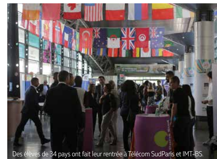
Des élèves de 34 pays ont fait leur rentrée à Télécom SudParis et IMT-BS.