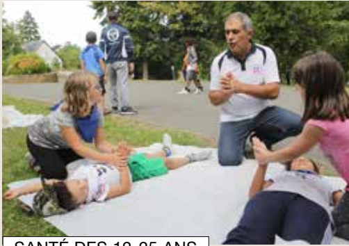
SANTÉ DES 12-25 ANS