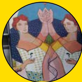
ACIDUM PROJECT L'Arbre de la vie 1, rue de l'Internationale