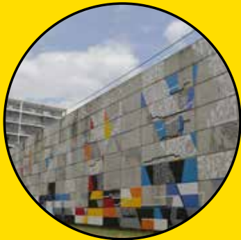
LEK & SOWAT Evryday i'm hustlin 16, rue du père André Jarlan