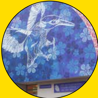
STEW 22, rue du Plessis Briard