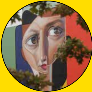
BELIN Laurita 44 boulevard des Coquibus