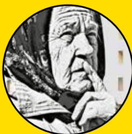
ECB Darya 8, rue Jules Vallès