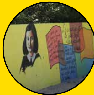
SAITH BAUTISTA Anne Franck Square Gutenberg