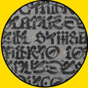
MONKEY BIRDS & Said Dokins Rue Georges Brassens