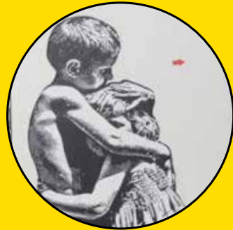
JEF AEROSOL City kids Mail Maurice Genevoix