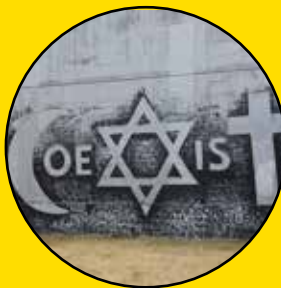
COMBO Coexist Rue Charles Fourier