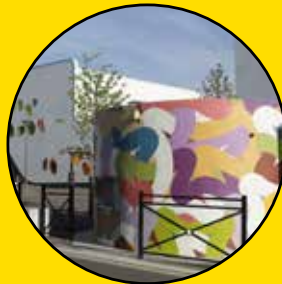
LEGZ The spaghettiist Allée Boissy d'Anglas

L'association Préfigurations propose régulièrement des visites guidées et commentées par des férus d'art pour partir à la découverte et interpréter des fresques aussi étonnantes qu'insolites. + d'infos : contact@prefigurations.com