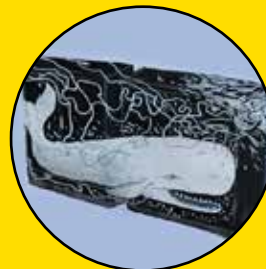
FLORENCE PICARD Moby Dick 9, boulevard de l'Yerres (voir pages 14-15)

Graffitis, pochoirs, peintures, mosaïques, stickers... L'art urbain est partout à Évry-Courcouronnes. La ville compte une vingtaine d'œuvres de street-art, un art à portée de tous qui transforme l'architecture, colore les murs et le mobilier urbain. Évry-Courcouronnes, musée à ciel ouvert ? Le Magazine vous invite à marcher dans les pas des street-artistes les plus emblématiques, venus de divers pays pour marquer la ville de leurs empreintes.