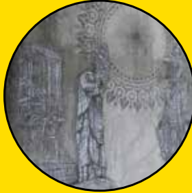
MONKEY BIRDS Partout dans la ville