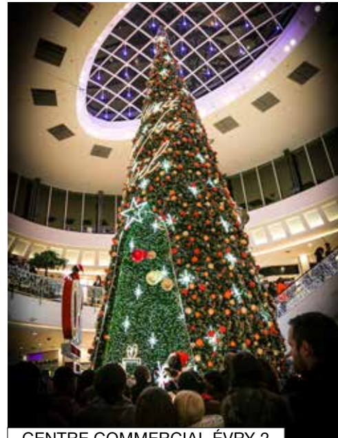
CENTRE COMMERCIAL ÉVRY 2

Tél : 01 69 91 58 85 patinoire@grandparissud.fr