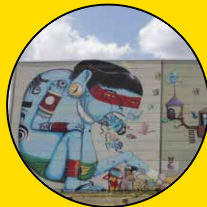
CRANIO Impasse Jean Anouilh