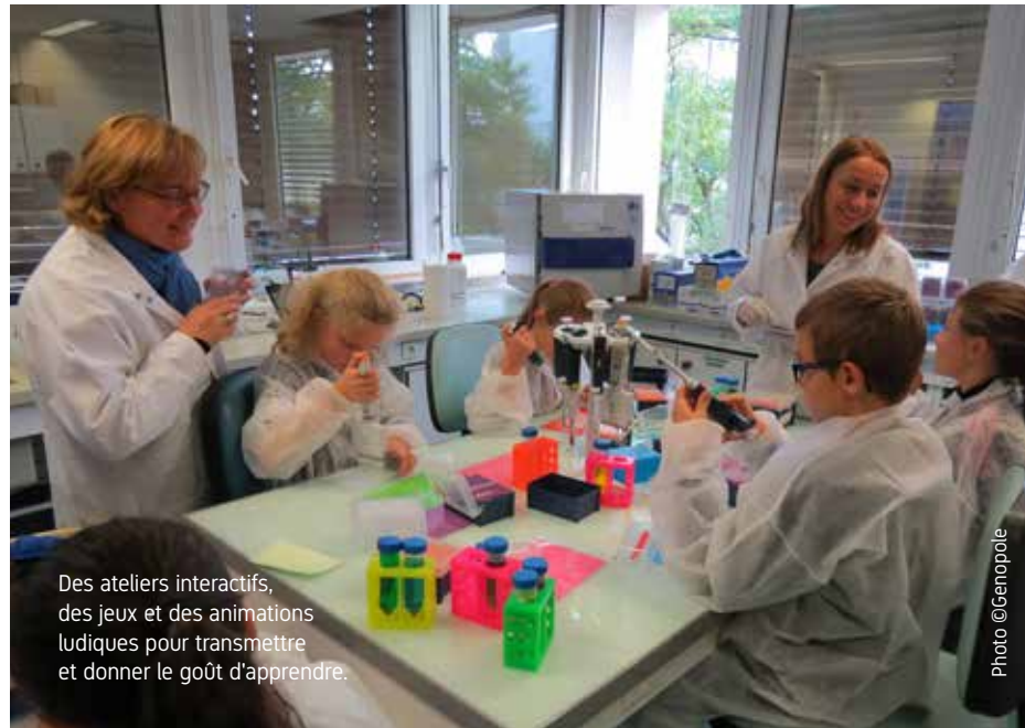
Des ateliers interactifs, des jeux et des animations ludiques pour transmettre et donner le goût d'apprendre.

l'épigénétique ou les mathématiques peut être à la portée de tous pour peu qu'on fasse l'effort de l'illustrer et de donner une information juste sans être simpliste ? Animés par la volonté de transmission et par leur passion de la recherche, plus d'une centaine de scientifiques participent chaque année à la Fête de la science et se creusent les méninges pour concevoir des ateliers interactifs, des jeux ou encore des expérimentations afin de rendre leurs thèmes de recherche en biologie, biothérapie, physique, informatique... abordables au plus grand nombre, notamment aux enfants. Chaque année, près de 3 000 personnes peuvent accéder à des laboratoires, assister à des conférences, échanger avec des scientifiques pour comprendre ce qui se déroule sur les campus de Genopole ou de l'Université.