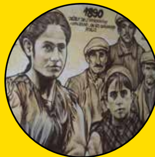
VINCE L'Arbre de la vie Entre les rues Charles Fourier et Henri Rochefort