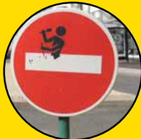
CLET Panneaux de signalisation Partout dans la ville