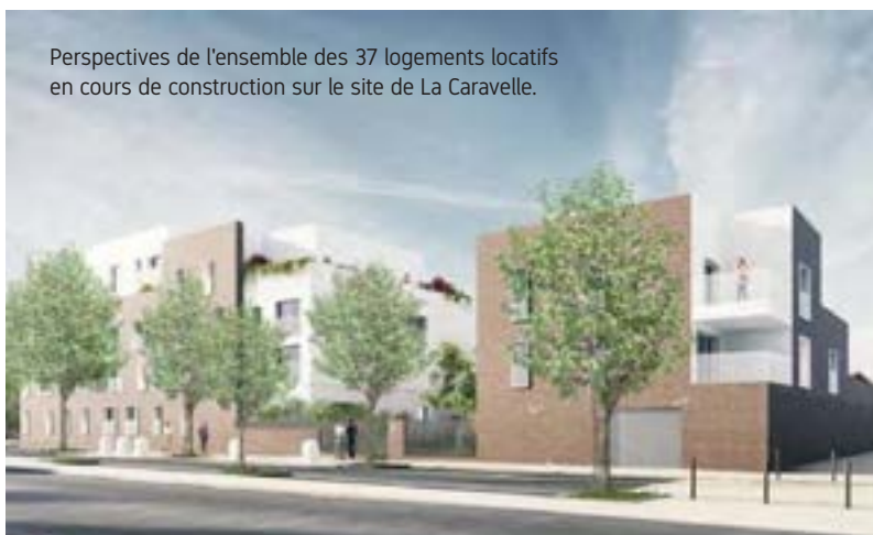
Perspectives de l'ensemble des 37 logements locatifs en cours de construction sur le site de La Caravelle.

Aujourd'hui, la première phase de rénovation urbaine s'achève. Les nombreux travaux ont permis d'ouvrir davantage le quartier sur le reste de la ville. Un second projet incluant les quartiers Pyramides et Bois Sauvage permettra d'achever la transformation de ce quartier emblématique de la Ville Nouvelle.