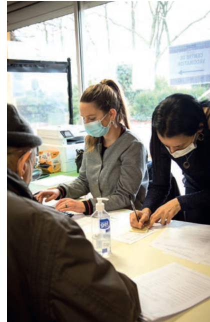
Deux sites de vaccinations ont été aménagés sur la Ville : dans les locaux du Foyer Club et dans la salle Nougaro.