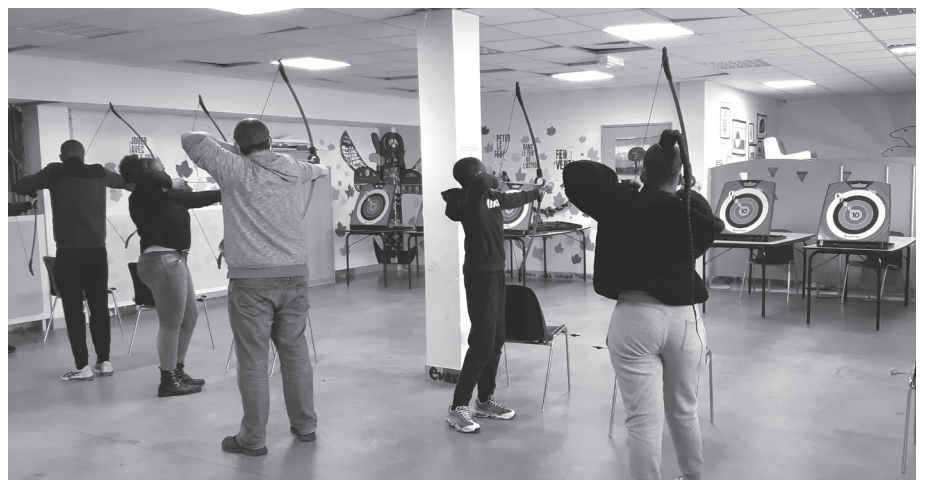
Initiation au tir à l'arc en marge des cours de soutien scolaire

Activités vacances scolaires : inscriptions du 10 au 16 avril. Se renseigner vos MQ-CS.