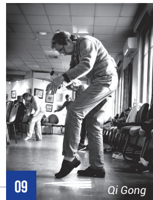
09 Qi Gong