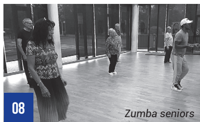
08 Zumba seniors