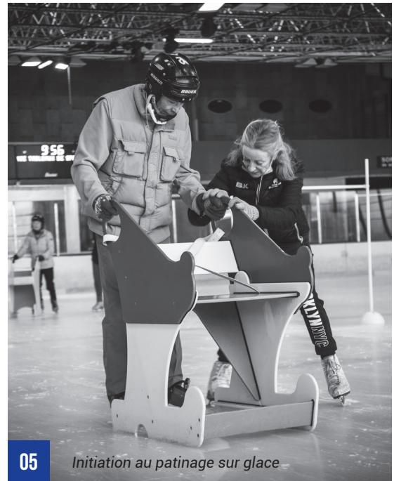
05 Initiation au patinage sur glace