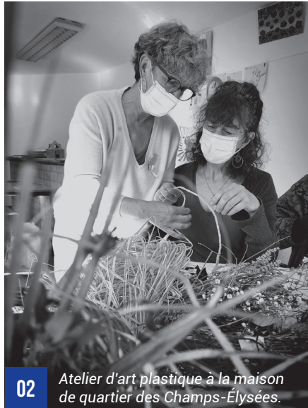
02 Atelier d'art plastique à la maison de quartier des Champs-Élysées.