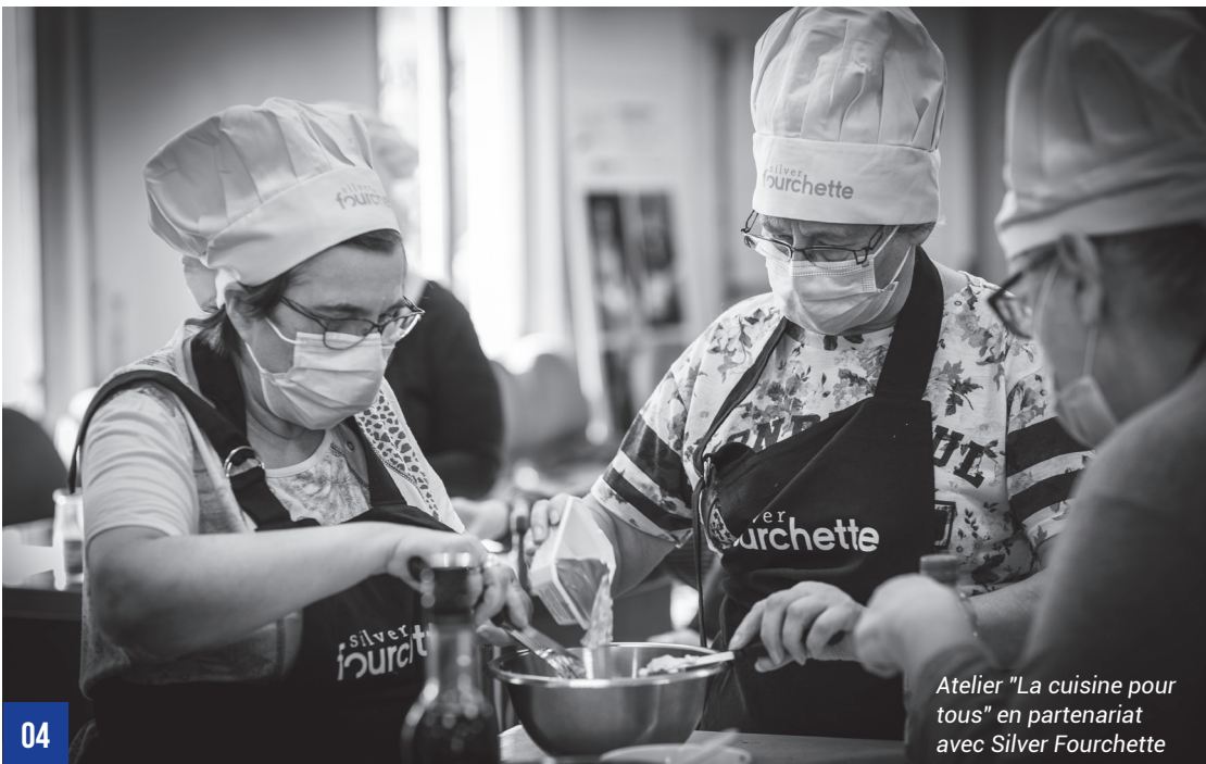
04 Atelier "La cuisine pour tous" en partenariat avec Silver Fourchette