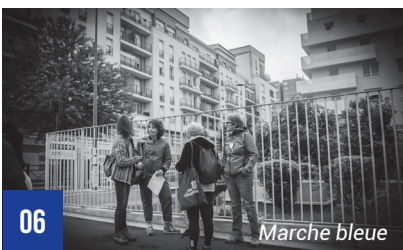
06 Marche bleue