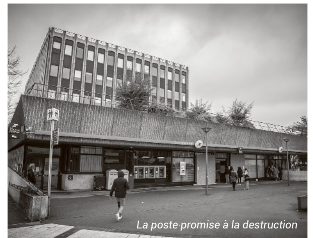
La poste promise à la destruction

Plus accessible, ce futur centre-ville fera la part belle aux nouvelles mobilités (vélo, trottinettes...) et aux piétons. Ces derniers pourront se déplacer d'un espace à l'autre sans discontinuité grâce à de nouvelles voies. Les visiteurs pourront ainsi déambuler sans jamais avoir le sentiment de se perdre.