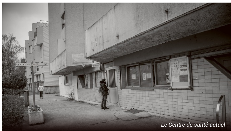
Le Centre de santé actuel

La zone comprenant les quartiers des Aunettes et des Épinettes est dotée d'une enveloppe de 3,2 millions € d'investissement en 2022.