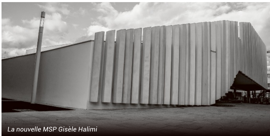
La nouvelle MSP Gisèle Halimi

En 2022, le quartier du Parc aux Lièvres verra l'inauguration de la Maison de services publics (MSP). Baptisée Gisèle Halimi, du nom de la célèbre avocate défenseuse du droit des femmes décédée en 2020, cette nouvelle structure symbolise la volonté de la Ville de faciliter les démarches des administrés. En un seul endroit sont regroupés cinq services : Mairie annexe, Maison de quartier, multi-accueil, Relais Petite Enfance (RPE) et lieu d'accueil parents-enfants. Les habitants pourront également accéder à des conseils personnalisés suivant leur situation. Ce projet fait partie du dispositif « Quartier innovants » porté par la région Île-de-France.