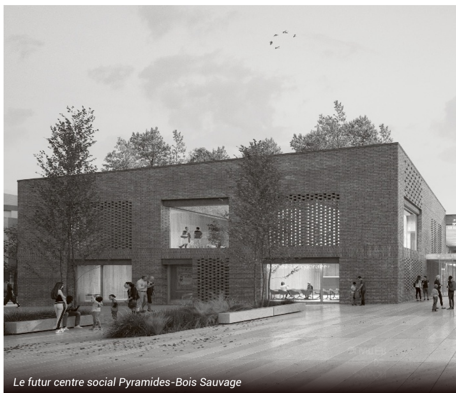
Le futur centre social Pyramides-Bois Sauvage

Actuellement en pleine mutation dans le cadre de la politique de rénovation urbaine, le quartier des Pyramides fera l'objet de nombreux investissements en 2022. Plus de 9 millions € seront engagés sur plusieurs chantiers dont la rénovation de l'école élémentaire Jules Verne ou encore la restructuration et l'agrandissement du Pôle de services publics et associatifs, un projet mené conjointement avec l'Agence Nationale de Rénovation Urbaine (ANRU) et la Caisse des Dépôts.