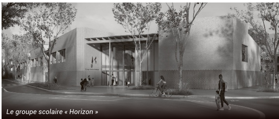
Le groupe scolaire « Horizon »

Ce chantier bénéficiera, à l'instar des autres écoles de la Ville, de matériaux à faible impact environnemental. Comme pour la maternelle, ces travaux seront réalisés en site occupé. Des bâtiments modulaires ont été installés devant l'école et dans la cour afin d'y recevoir les élèves.