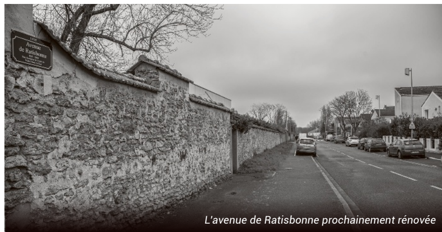
L'avenue de Ratisbonne prochainement rénovée

Plus de 2,5 millions € seront injectés en 2022 pour la réhabilitation d'équipements collectifs dans les quartiers Grand Bourg, Champs-Élysées et du Parc aux Biches. Les gymnases Carpentier dans le quartier des Champs-Élysées ainsi que celui de Descartes au Champrier du Coq seront rénovés et dotés de nouveaux matériels pour des investissements respectifs de 170.000 € et 340.000 €. L'avenue de Ratisbonne sera, quant à elle, entièrement refaite sur le modèle de la rue Emmanuel Pastré dans le quartier du Village. Plusieurs diagnostics (amiante, structure, eau, éclairage public...) ainsi que les levés topographiques seront réalisés après quoi le projet entrera dans la phase de concertation. Il devrait démarrer fin 2022 à la suite des études de faisabilité, de la définition du chronogramme des travaux ainsi que la réalisation d'un Dossier de Consultation des Entreprises (DCE). Coût de l'investissement : 1 million €.