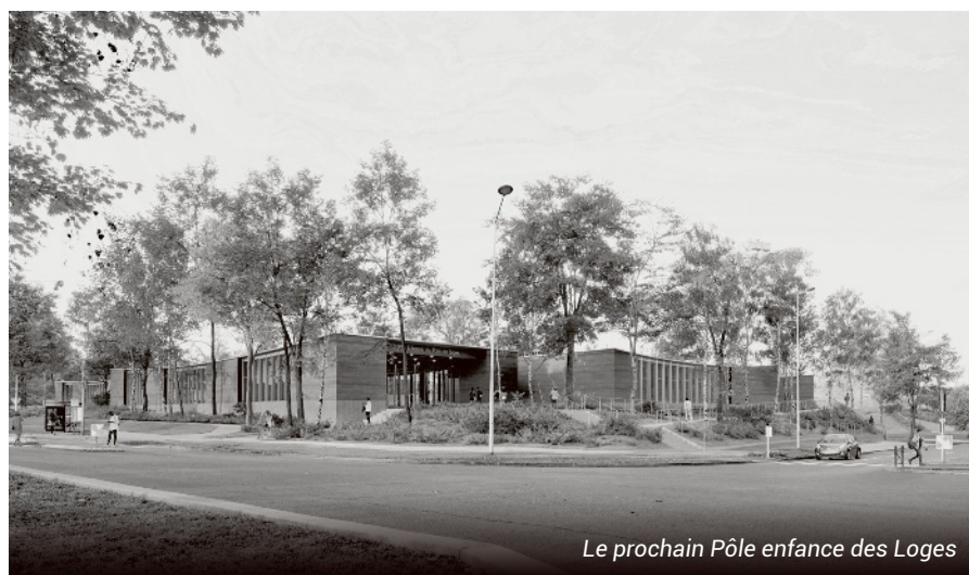
Le prochain Pôle enfance des Loges

Dans le quartier du Bois Sauvage qui jouxte celui des Pyramides, 1 million € de budget est affecté à la rénovation du groupe scolaire Bois Guillaume et à celle, partielle, du gymnase des Loges. Le Pôle enfance des Loges est l'autre chantier emblématique de l'année. Niché au parc des Loges, au cœur de la verdure et des frondaisons, ce nouvel équipement est attendu pour septembre 2024 après le dépôt du permis de construire qui doit intervenir au printemps prochain. Dans un même lieu, il réunira le Relais Petite Enfance (RPE) ainsi que les accueils de loisirs maternels et élémentaires. Une salle de sport et une tribune y seront adossées. Le coût global de ce projet financé par la Ville mais également par la Région Ile-de-France, la Caisse des Dépôts et l'Agence Nationale de Rénovation Urbaine (ANRU) est de 14 millions €. Ce projet est confié au cabinet Hema Architectes et au cabinet Wald pour l'agencement paysager.