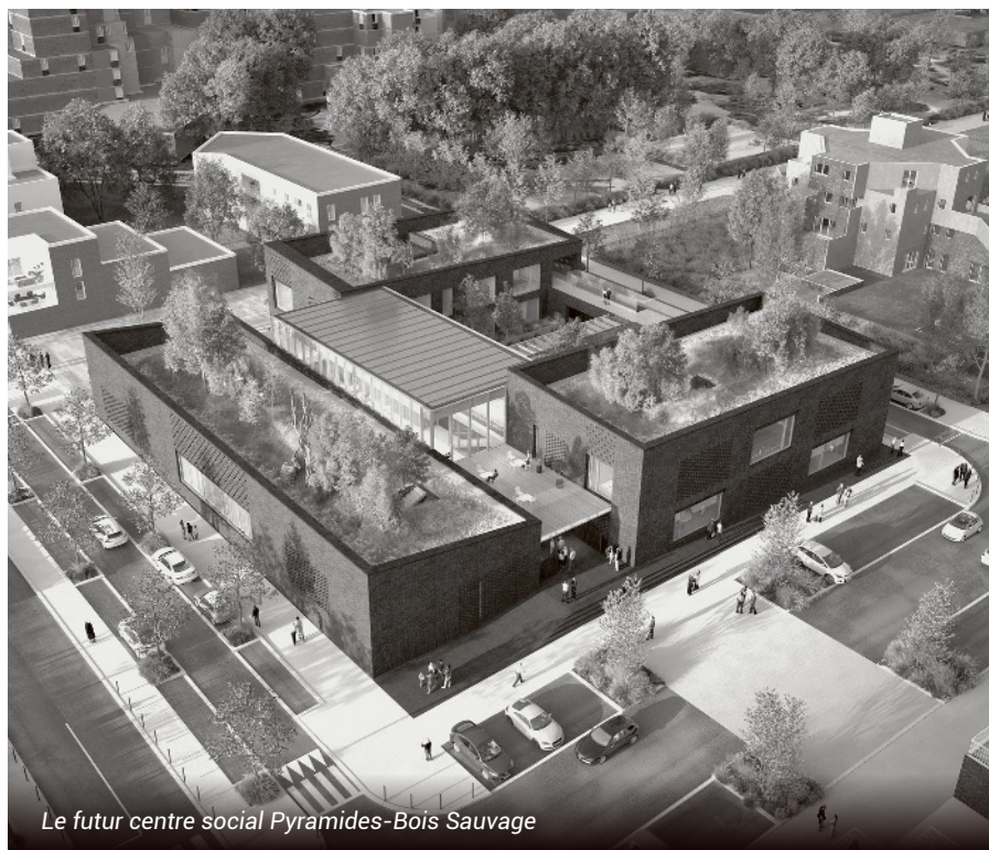
Le futur centre social Pyramides-Bois Sauvage

Les espaces intérieurs seront ré-agencés et rénovés, et la cour végétalisée. Toutes les huisseries doivent être remplacées. Des bâtiments modulaires seront installés dans cette même cour pour y accueillir, en alternance, les enfants des classes en travaux. L'installation d'équipements numériques sera privilégiée.