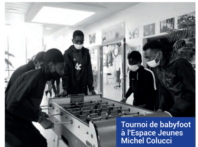
Tournoi de babyfoot à l'Espace Jeunes Michel Colucci