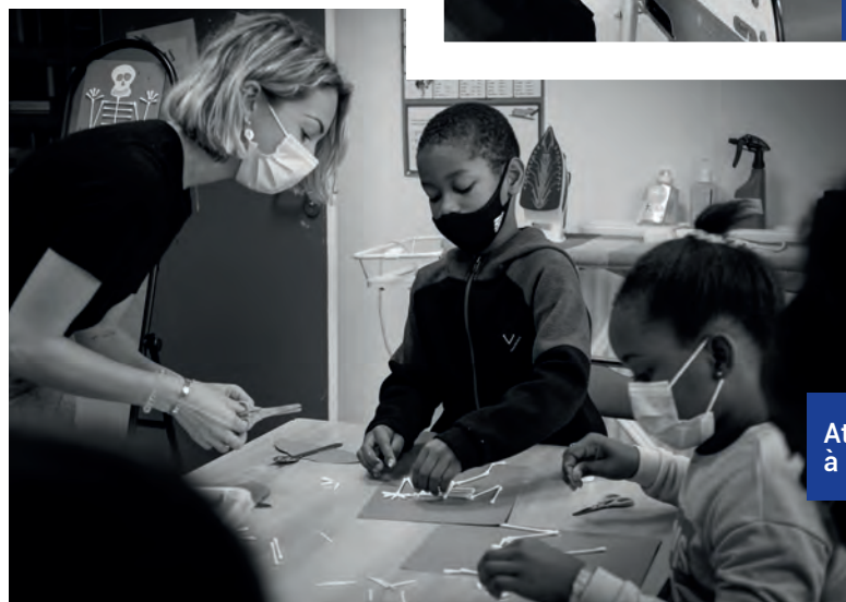
Atelier Halloween à la MJC Simone Signoret