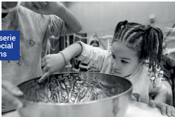
Atelier pâtisserie au Centre social Brel-Brassens