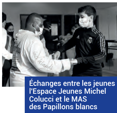
Échanges entre les jeunes l'Espace Jeunes Michel Colucci et le MAS des Papillons blancs