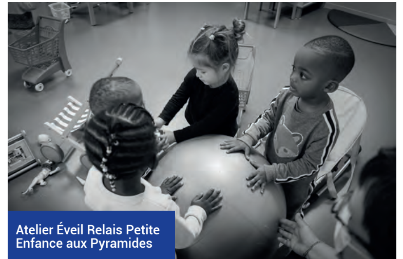
Atelier Éveil Relais Petite Enfance aux Pyramides