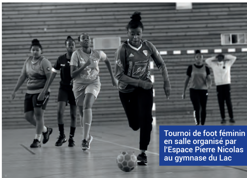
Tournoi de foot féminin en salle organisé par l'Espace Pierre Nicolas au gymnase du Lac