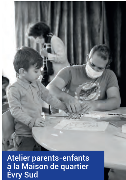
Atelier parents-enfants à la Maison de quartier Évry Sud

Qu'il s'agisse d'ateliers créatifs, de sport ou de la préparation de la soirée d'Halloween, les centres sociaux de la Ville et les espaces dédiés à la jeunesse ont été mobilisés, durant ces deux semaines de congés, pour accompagner enfants, adolescents et parents dans la découverte d'activités ludiques. Retour en images.