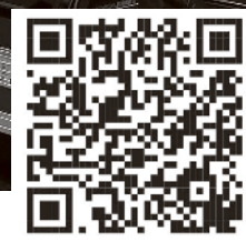
Flashez le QR code pour la visionner sur Youtube