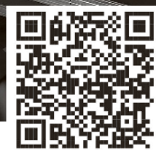
Flashez le QR code pour la visionner sur Facebook