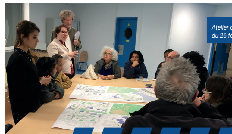
Atelier de concertation du 26 février 2020.

Deux variantes de projet ont été présentées : une comportant 50 logements neufs, l'autre 100 logements neufs. Des échanges en groupes ont permis d'identifier les avantages et les inconvénients des deux variantes.