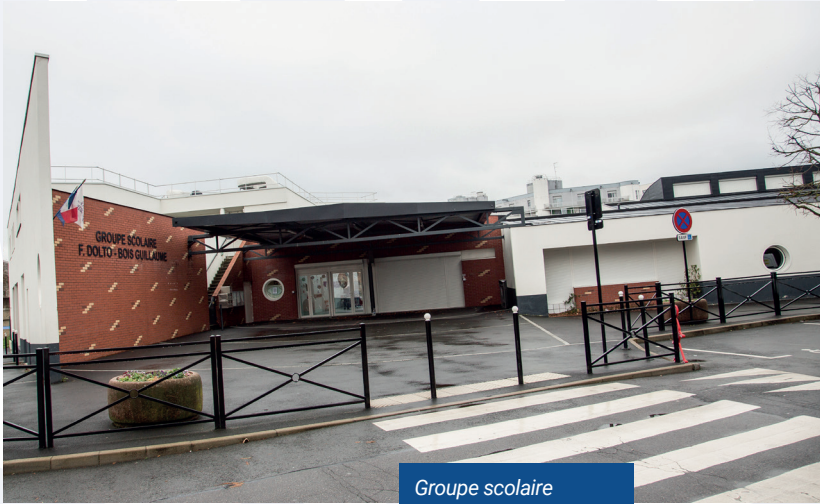
Groupe scolaire Françoise Dolto et Maison de quartier.

Point d'étape sur le nouveau Programme de rénovation urbaine