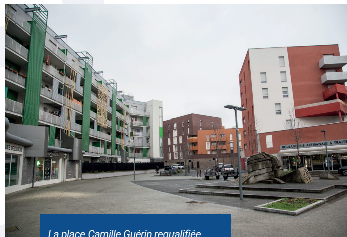
La place Camille Guérin requalifiée avec les nouveaux commerces.

Cette première phase du Programme de rénovation urbaine s'achève avec la livraison des derniers bâtiments Constructa, au printemps 2021.