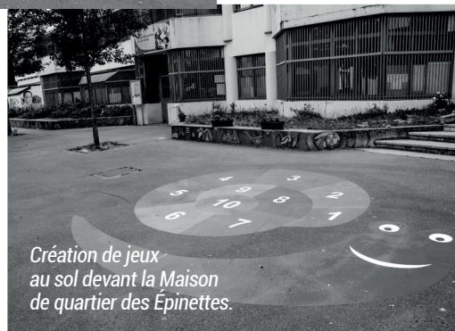
Création de jeux au sol devant la Maison de quartier des Épinettes.