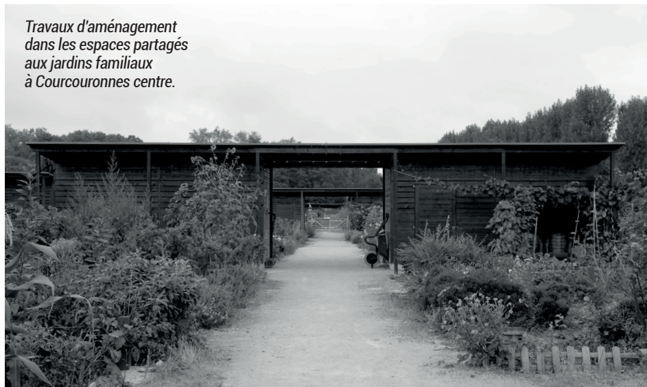
Travaux d'aménagement dans les espaces partagés aux jardins familiaux à Courcouronnes centre.