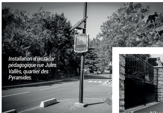
Installation d'un radar pédagogique rue Jules Vallès, quartier des Pyramides.