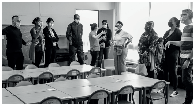
Au groupe scolaire des Coquibus, les travaux nécessitent l'installation de préfabriqués, la délocalisation de classes à Malézieux et la mise en place d'un système de navettes entre les deux sites.

Tour d'horizon des principaux travaux réalisés cet été dans les écoles maternelle et élémentaire de la ville.