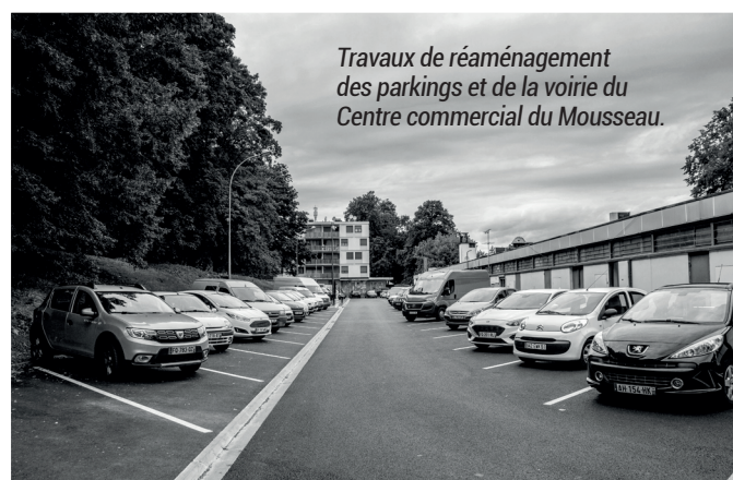
Travaux de réaménagement des parkings et de la voirie du Centre commercial du Mousseau.