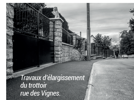
Travaux d'élargissement du trottoir rue des Vignes.