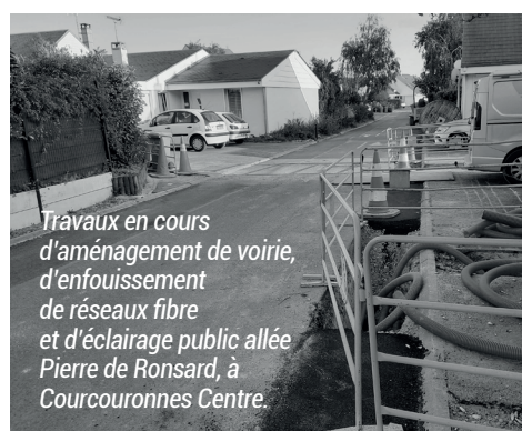
Travaux en cours d'aménagement de voirie, d'enfouissement de réseaux fibre et d'éclairage public allée Pierre de Ronsard, à Courcouronnes Centre.