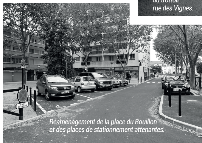
Réaménagement de la place du Rouillon et des places de stationnement attenantes.